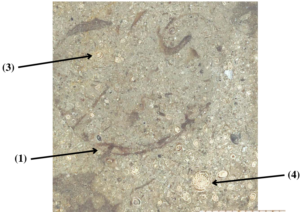
110_3 : détail (x 3)